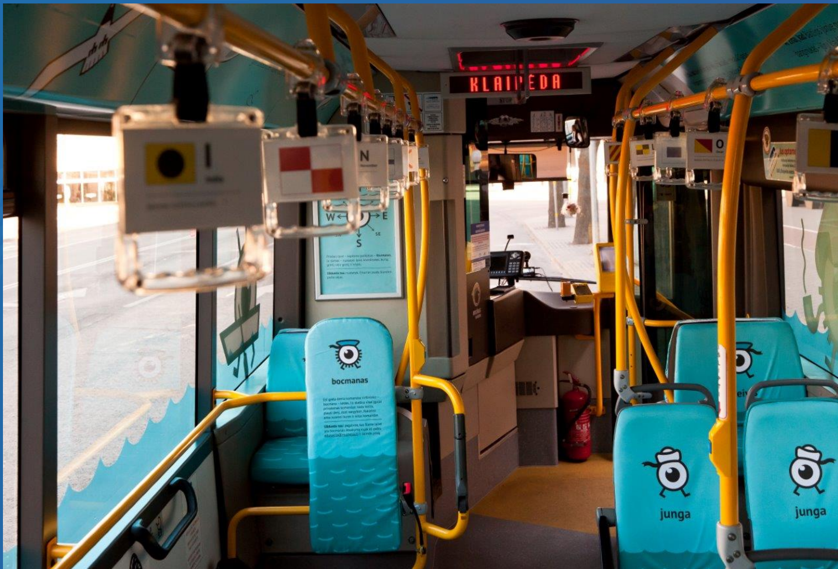
Projekts „Mūzē veža“