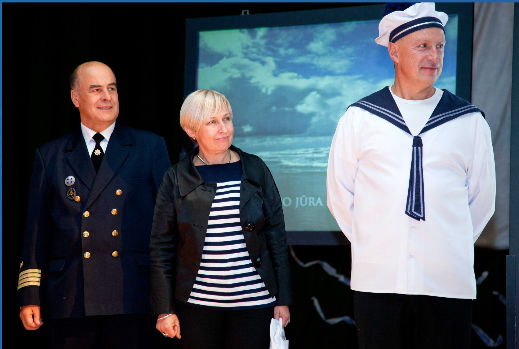
Projektas „Mano jūra – tolima ir artima“