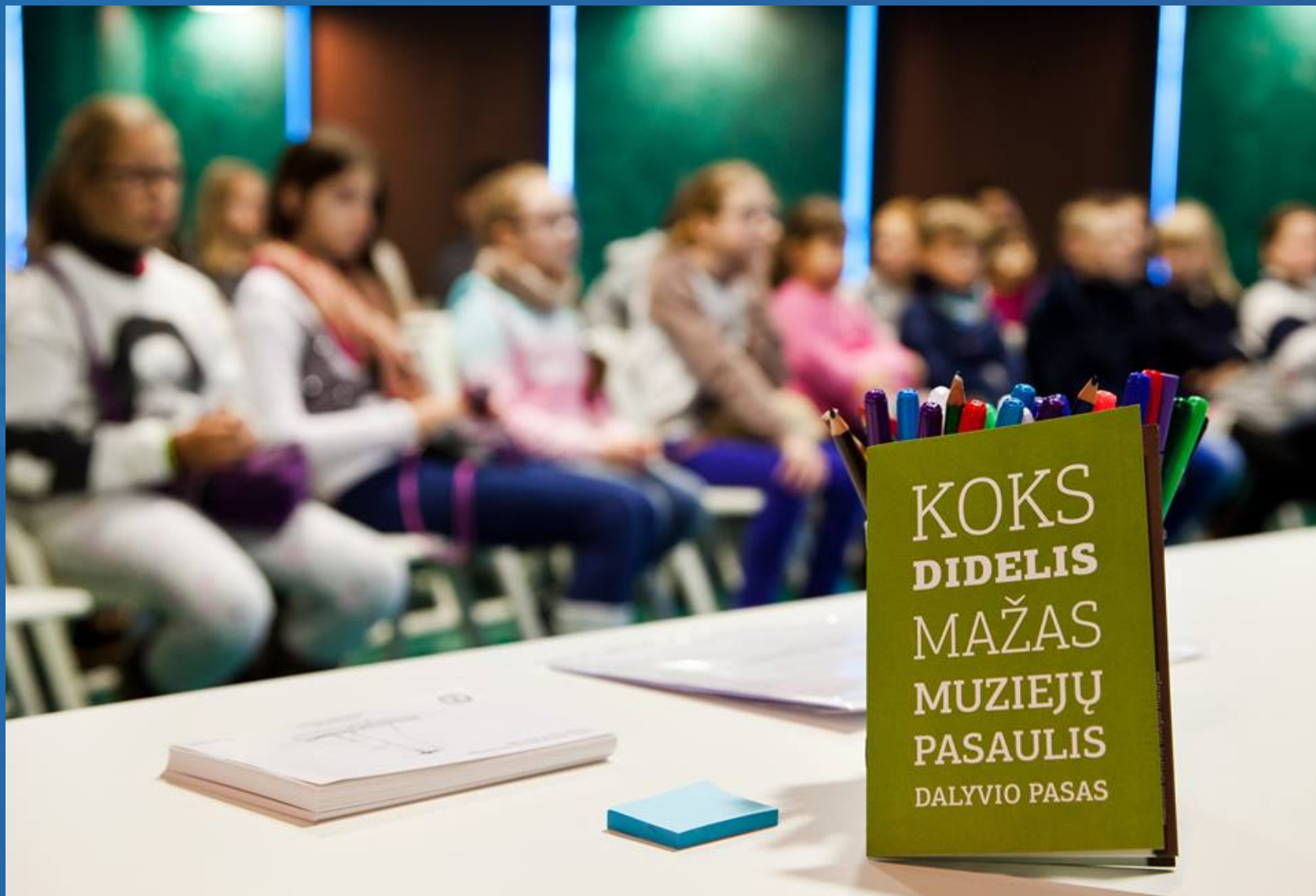
Projektas „Koks didelis mažas muziejų pasaulis“