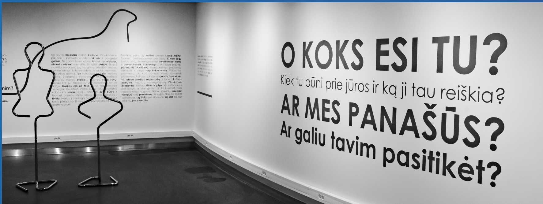
Projektas „Vandens gyvenimo linija“